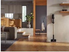
Foto 1: Der neue Miele Duoflex HX1 lässt sich durch sein ansprechendes und modernes Design sichtbar in das Wohnumfeld integrieren. Lästiges Verstauen gehört damit der Vergangenheit an.