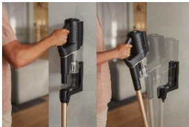
Foto 3: Die SpeedLock-Wandhalterung des Miele Duoflex HX1 ermöglicht den passenden Geräteaufbau mit nur einem Handgriff. (Foto: Miele)

Foto 2: Dank des innovativen SpeedLock-Verriegelungssystems kann der Miele Duoflex HX1 schnell und mühelos als Komplett- oder Handgerät eingesetzt werden. (Foto: Miele)